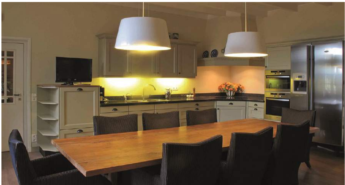
Een deel van de gemeenschappelijke ruimte